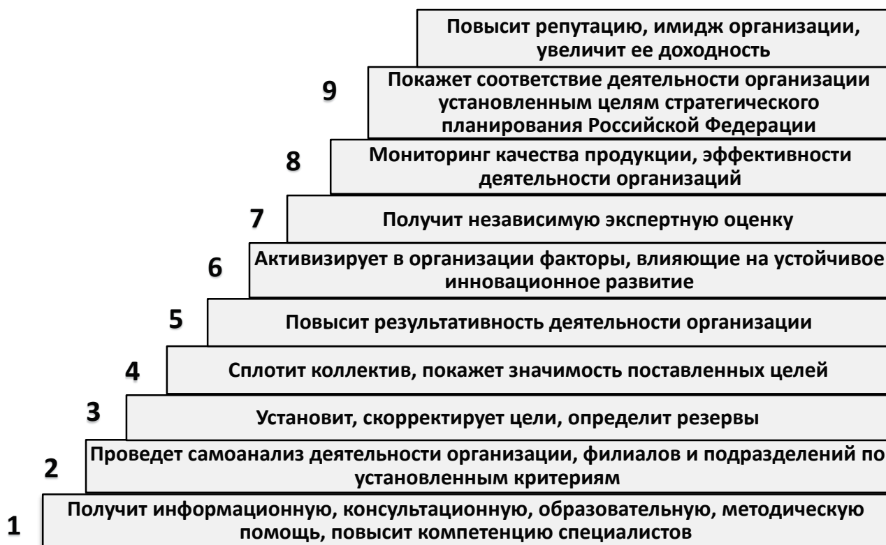
Рис. 1 Какие результаты получит участник Конкурса

2.4. Результаты применения методики самооценки по модели Конкурса и участие в Конкурсе позволяет организациям получить широкий спектр результатов, которые показаны на рис.1.