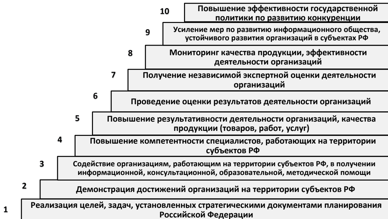
Рис. 3 Какие результаты получит руководство Российской Федерации при поддержке Конкурса

2.8. Модель конкурса и методика расчета Индекса качества, инновационной активности, устойчивого развития организаций позволяет регулировать общественные отношения с применением новых технологий управления.