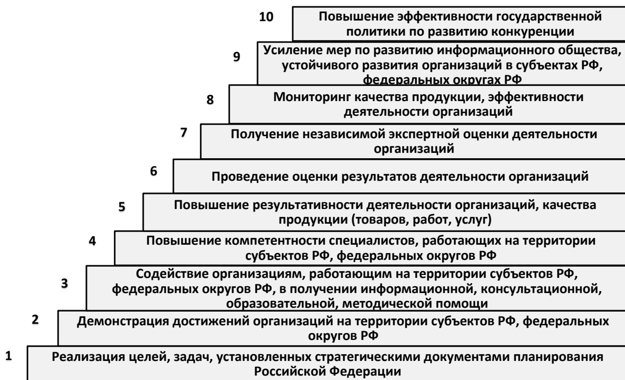
Рис. 2 Какие результаты получит руководство субъектов Российской Федерации при поддержке Конкурса

2.6. Организация конкурсов на уровне субъектов Российской Федерации и федеральных округов Российской Федерации позволяет получить дополнительный эффект, результаты которого показаны на рис. 2.